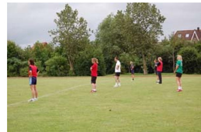
Großfeldhandball (nicht ganz so schnell wie Hallenhandball)

Den Höhepunkt des Handballjahres 2009 stellte unser Jubiläums-Spartenfest im Juni dar. 10 Jahre Handballspielgemeinschaft mit Nusse und gleichzeitig 3 Jahre DHG Sandesneben Und das haben wir ein ganzes Wochenende gefeiert.